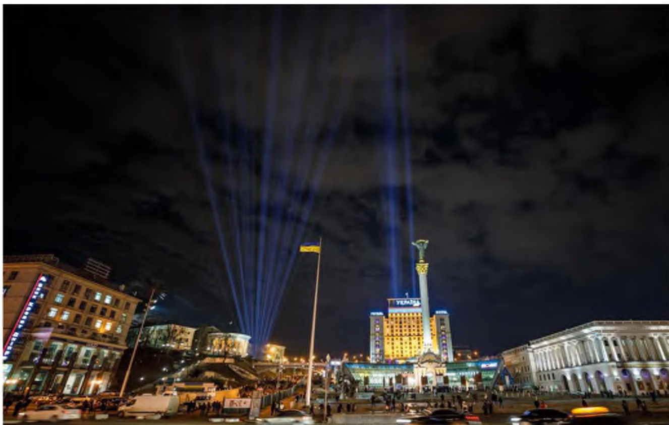
Промені Гідності. Світлина з медіаархіву НМРГ

До другої річниці створення Музею, 18 листопада 2017 року, світлову інсталяцію розмістили на місці майбутнього меморіально-музейного комплексу. До початку широкомасштабного вторгнення росії в Україну щороку 20 лютого під час відзначення Дня Героїв Небесної Сотні на знак пам'яті про загиблих учасників Революції Гідності на алеї Героїв Небесної Сотні Музей запалював 107 променів. Під час режиму воєнного стану з огляду на безпекові заходи промені не запалюють.