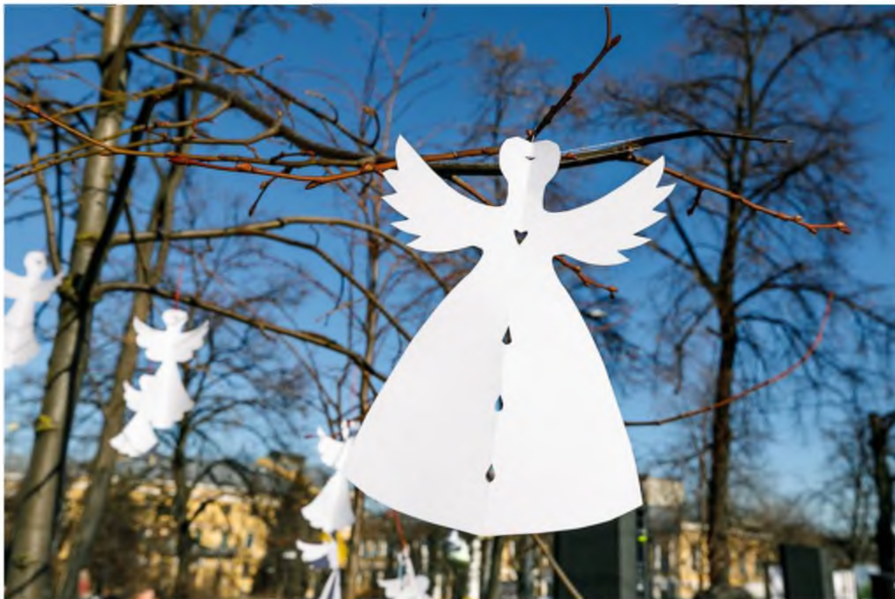
Ангели на алеї героїв Небесної Сотні.

Всесвітню тиху акцію “Ангели пам’яті”, присвячену Небесній Сотні, ініціювали громадська активістка та співачка Анжеліка Рудницька й мистецька агенція “Територія А”. У пам’ять про активістів Майдану традиційно розвішують паперових ангелів на місці розстрілу найбільшої кількості мітингувальників. Ангели символізують душі загиблих борців за свободу та перемогу світла над темрявою.