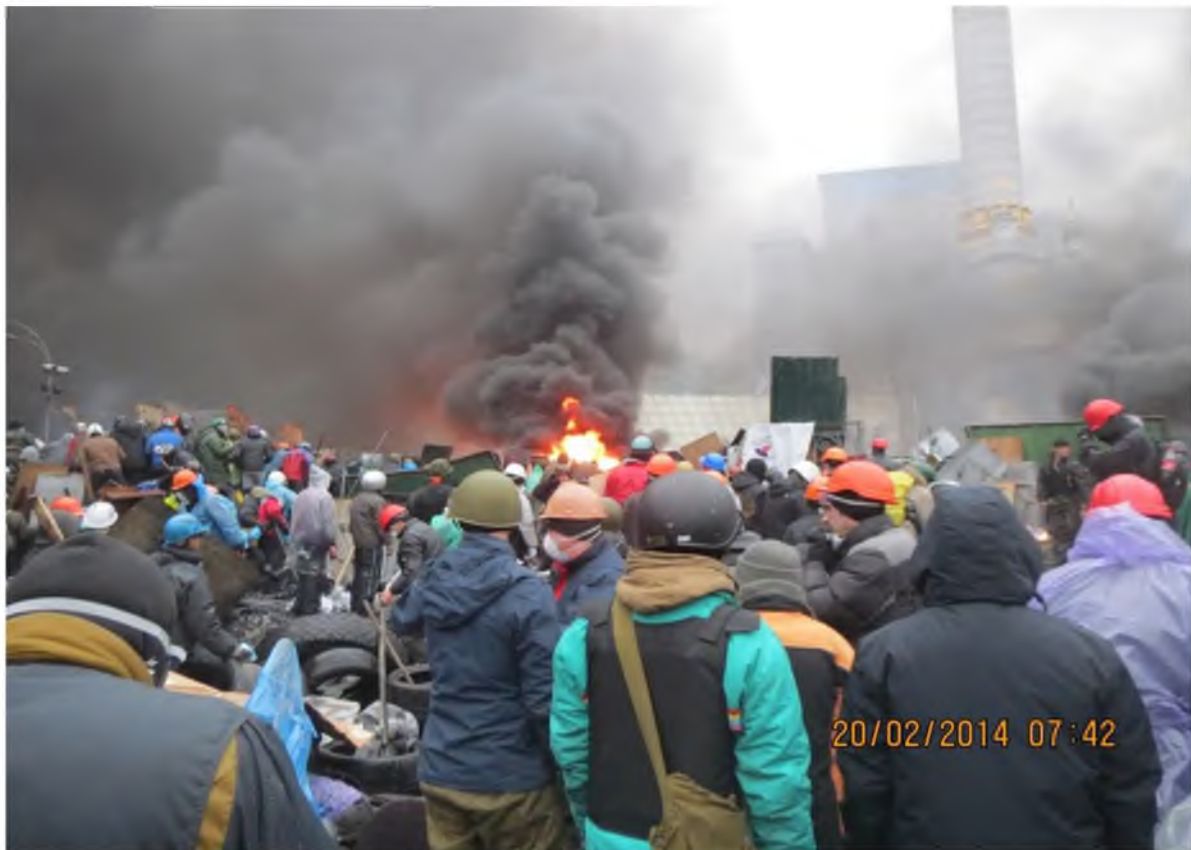
Майдан. Ранок 20 лютого на майдані Незалежності.