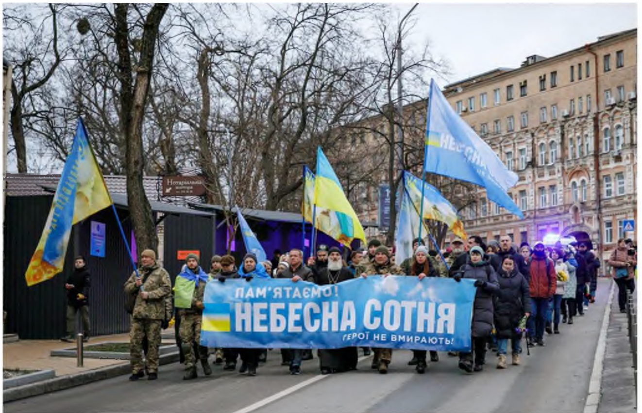
Щорічна хода пам'яті.