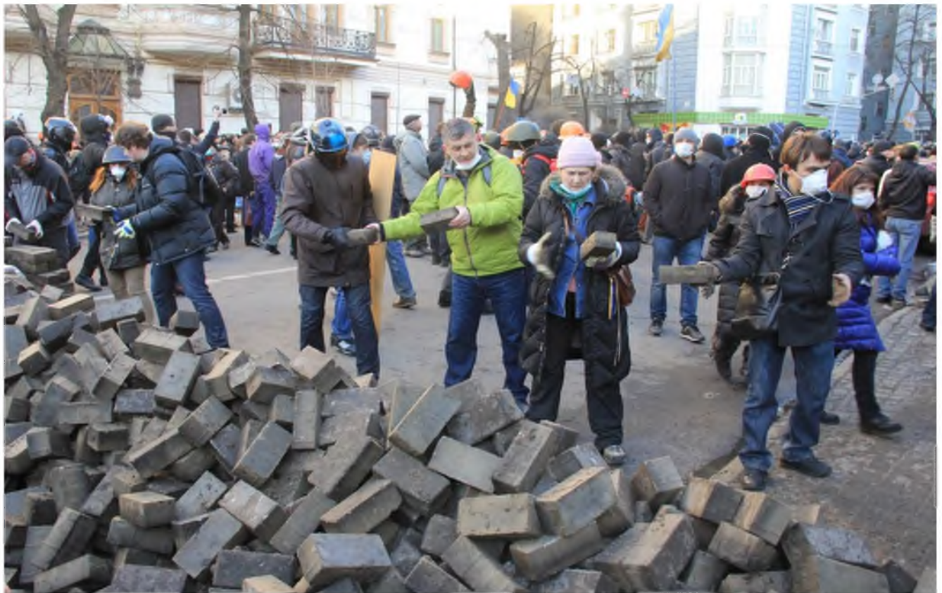
Зведення барикад на вул. Інститутській 18 лютого.

О 16:03 СБУ та МВС висунули опозиції ультиматум – припинити протистояння та звільнити Майдан до 18:00.