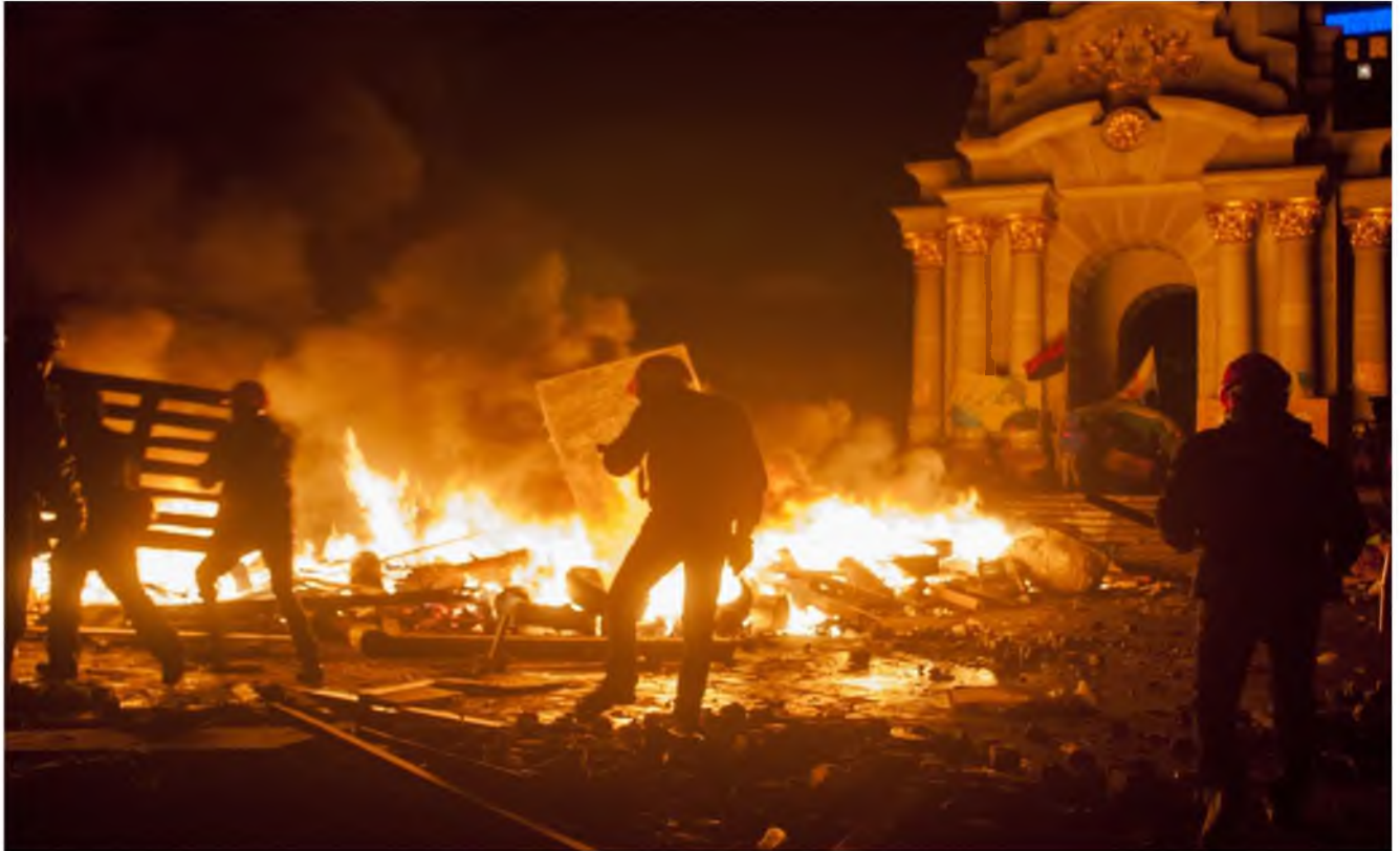
Ніч 19 лютого на майдані Незалежності.

О третій ночі барикаду на Хрещатику з боку Європейської площі було зруйновано, а від Будинку Федерації профспілок України до монумента Незалежності простягалася вогняна барикада.