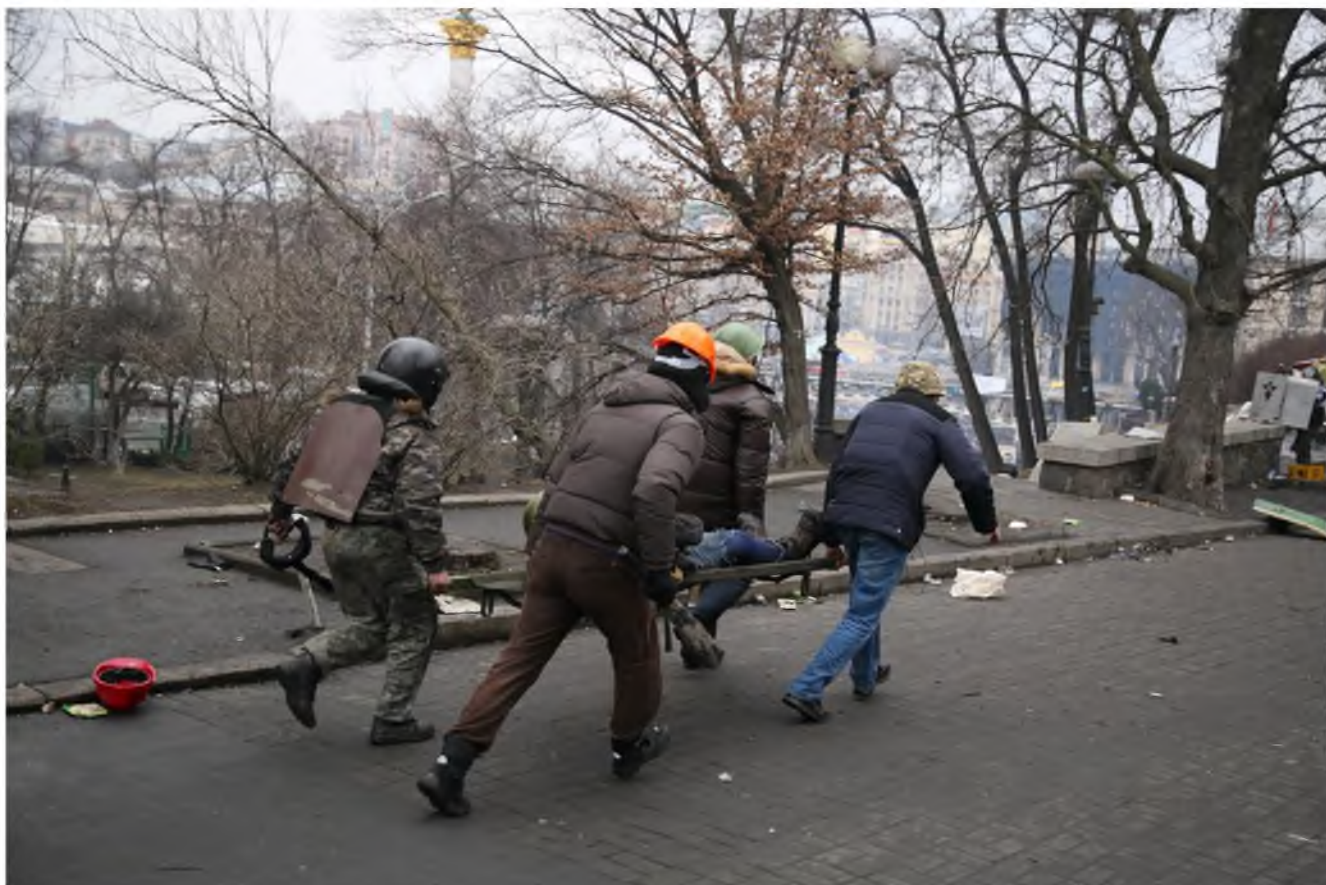
20 лютого 2014 р. Евакуація пораненого.