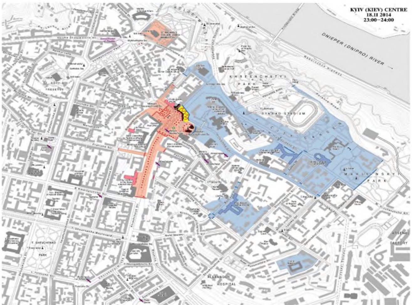
Карта середмістя Києва з розстановкою сил станом на 23:00 18 лютого 2014 року. Рожевим кольором позначено територію Майдану, блакитним – розташування силовиків, чорним – вогняні барикади та намети. Автор карти Дмитро Вортман.