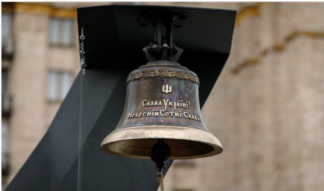
Дзвін Гідності на алеї Героїв Небесної Сотні у Києві.

Персональне вшанування кожного з Небесної Сотні є важливою практикою інституалізації суспільної пам'яті про події Революції Гідності, розширення загальнодоступних форм пошанування пам'яті загиблих, що слугує зокрема впровадженню в суспільстві моральних імперативів, гідних поваги та наслідування. Більше інформації за посиланням.