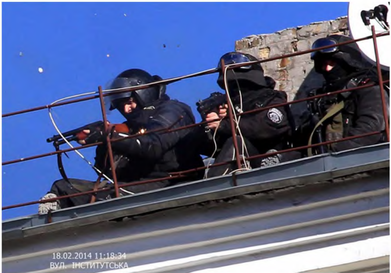
Силовики на дахах урядового кварталу ціляться в учасників «мирного наступу».