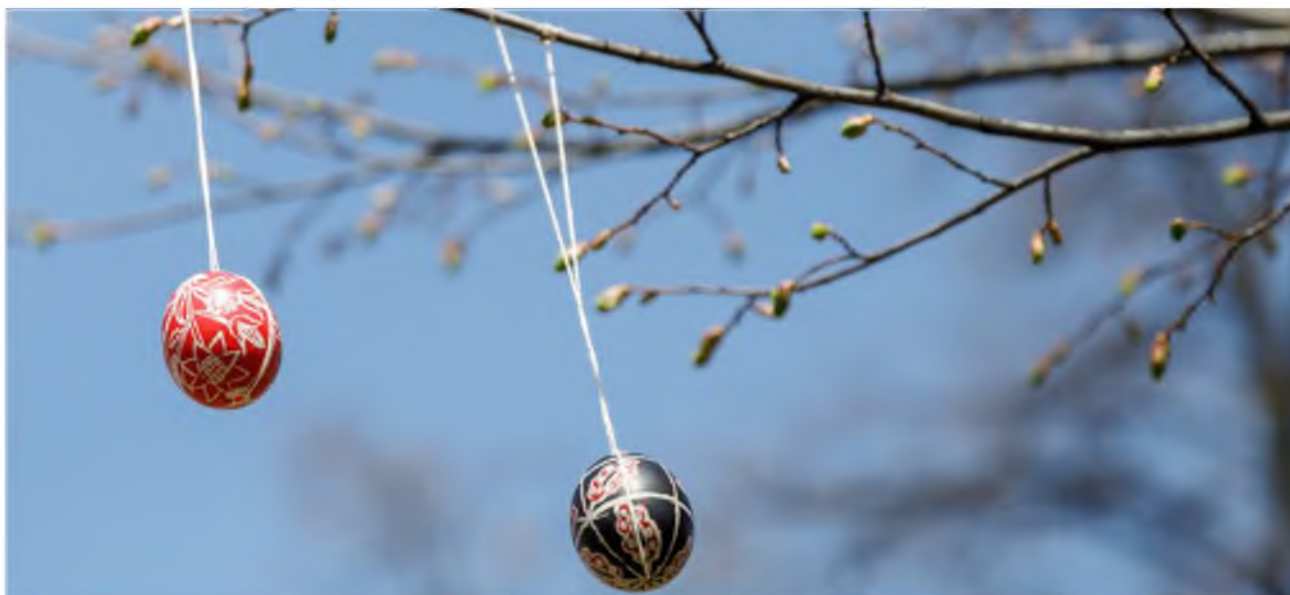
Великодні символи на алеї Героїв Небесної Сотні.

Акцію “Різдво для Героя” було ініційовано родинами Героїв Небесної Сотні. У межах заходу для вшанування загиблих до пам’ятних місць кладуть різдвяні вінки, сплетені напередодні.