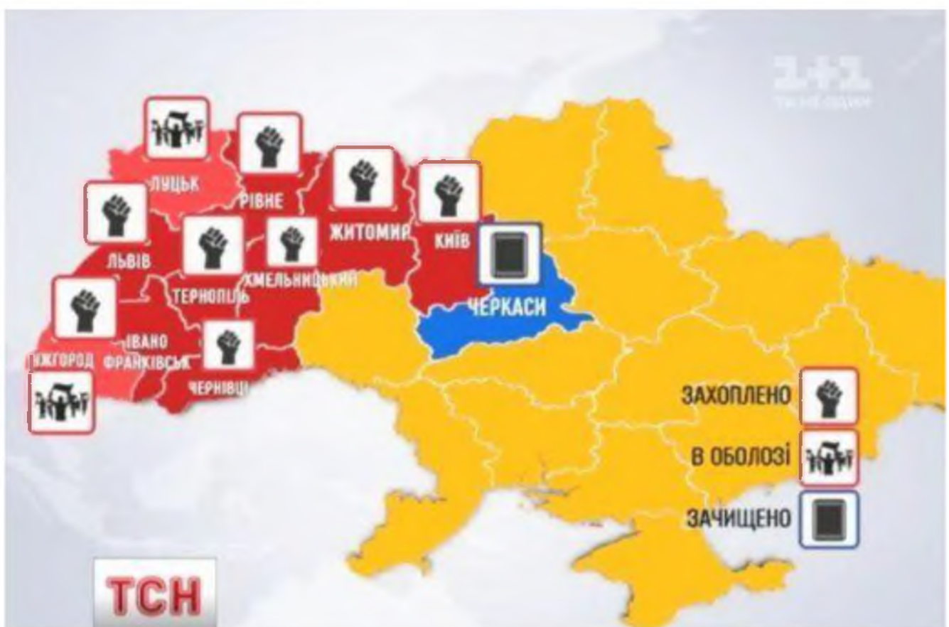
Карта України з позначенням міст, в яких активісти взяли під контроль будівлі державних адміністрацій, станом на 24 січня 2014 року. Із сайту ТСН: https://tsn.ua/vypusky/tsn/vipusk-tsn-19-30-za-24-sichnya-2014-roku-331206.html

На засіданні Штабу національного спротиву ухвалили рішення про активізацію Майданів у регіонах. Як наслідок, в областях України активісти почали збиратись у будівлях обласних державних адміністрацій, щоб не дати представникам влади можливість застосовувати силові методи. Станом на кінець дня 24 січня під контроль протестувальників було взято вісім облдержадміністрацій (разом із Київською міською державною адміністрацією, яку мітингарі контролювали ще від 1 грудня 2013 року): Івано-Франківську, Чернівецьку, Тернопільську, Рівненську, Львівську, Хмельницьку ОДА, Житомирську МДА. У Луцьку й Ужгороді активісти оточили будівлі адміністрацій. У Черкасах силовикам удалося відбити у мітингувальників приміщення раніше захопленої адміністрації.