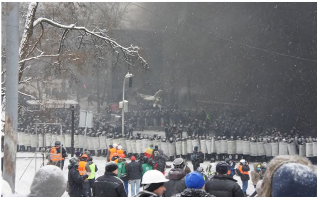
Вулиця Грушевського 22 січня 2014 року.

Саме в річницю проголошення незалежності Української Народної Республіки та День Соборності серед протестувальників з'явилися перші загиблі від вогнепальних поранень. Неподалік від колони стадіону "Динамо" в часовому проміжку між 05:30 і 05:40 вогнепальні поранення в шию, голову та груди отримав 20-річний вірменин Сергій Нігоян, майданівець із Дніпропетровської області. Мобільна бригада медиків перенесла активіста до медичного пункту, розташованого у вестибюлі будівлі Національної академії наук України на вулиці Михайла Грушевського, 4, та надала першу медичну допомогу. Однак уже за пів години лікарі констатували його загибель. Згодом до того ж самого медпункту було доставлено тіло ще одного важко пораненого – білоруса Михайла Жизневського, який отримав смертельне поранення у грудну клітку в часовому проміжку між 08:30 і 09:00 під час чергового штурму силовиків.